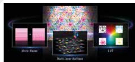
Tecnologia Precision Dot

Con 3.200 ugelli ciascuna, le 4 grandi testine PrecisionCore MicroTFP (6 per il modello SC-F10000H) larghe circa 12 cm consentono di stampare agevolmente su ampie superfici. La tecnologia Epson Precision Dot integrata unisce tre tecnologie specifiche (Half Tone Module, LUT e Micro Weave) per garantire una migliore finitura delle stampe.