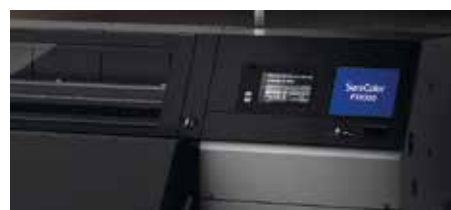
Pannelli esterni in metallo

Negli ambienti industriali è importante ottimizzare gli spazi, per questo SureColor SC-F10000 e SC-F10000H hanno un ingombro ridotto della metà rispetto ad alcune stampanti della concorrenza. I pannelli esterni in metallo, inoltre, assicurano un'elevata resistenza anche nelle condizioni più difficili.