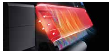
Sistema di asciugatura

Molto spesso il successo dipende dalla velocità: ecco perché queste stampanti sono dotate di un sistema di asciugatura che evita il trasferimento dell'inchiostro. La temperatura sulla superficie del supporto è controllata in modo efficiente tramite riscaldatori nella parte anteriore e sul retro del supporto stesso. Il risultato? Stampe perfette, senza quelle pieghe a volte causate da un'asciugatura non adeguata.